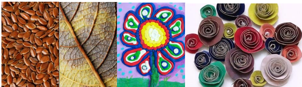
Semillas, hojitas naturales, relieves con plastimasa, caracolitos de papel