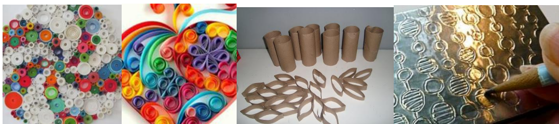
Rulitos de papel, tiritas de papel o cartón, dibujado sobre tapitas de papel aluminio