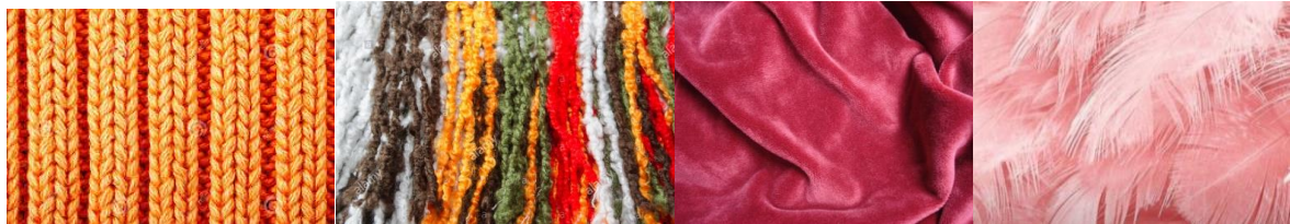
Tejidos, lanas, telitas, plumas