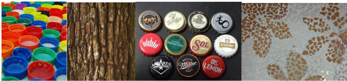
Tapitas, corteza de árbol, chapitas, cáscara de huevo