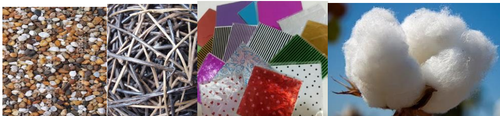
Piedritas, ramitas, papeles de envoltorio, trocitos de algodón