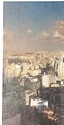
Vista del centro de la ciudad de San Pablo, en Brasil. Este país es el más industrializado del Mercosur.

Estas desigualdades económicas y sociales , llamadas asimetrías, han influido negativamente en el proceso de integración, ya que hacen más difícil encontrar políticas comunes que sean adecuadas a todos los países. Tratar de reducir esas asimetrías se ha convertido en uno de los mayores desafíos del bloque.