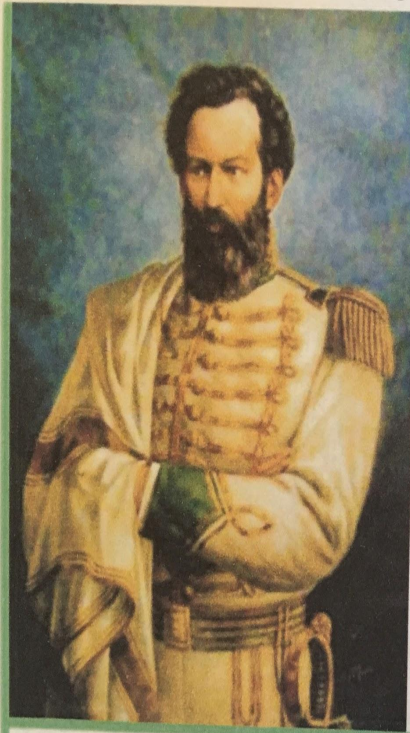
Martín Miguel de Güemes

Martín Miguel de Güemes fue un caudillo salteño que desde esa provincia protagonizó la resistencia contra los realistas. Organizó milicias entregando armas al pueblo salteño, que junto a otros de la región se convirtieron en los llamados "gauchos de Güemes". Más tarde, Belgrano lo dejó al mando del ejército del Norte.