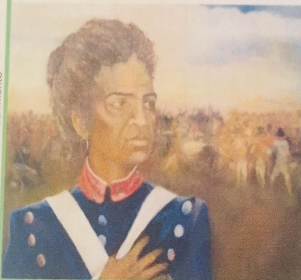
María Remedios del Valle, la Capitana.