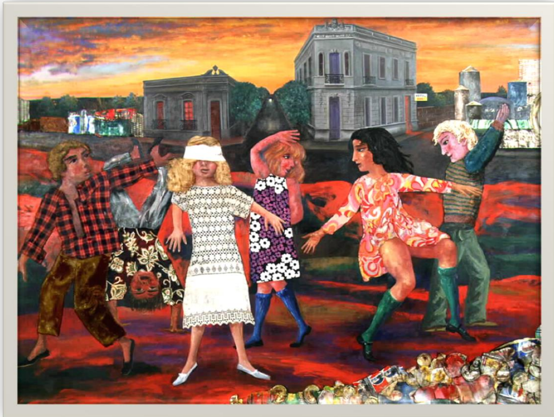
“La gallina ciega” – Antonio Berni – Argentina - 1973