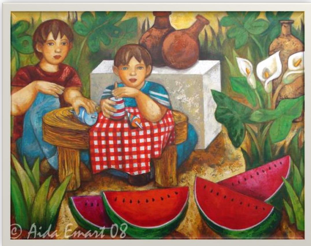
Juego de niños – Aida Emart – México- 2008