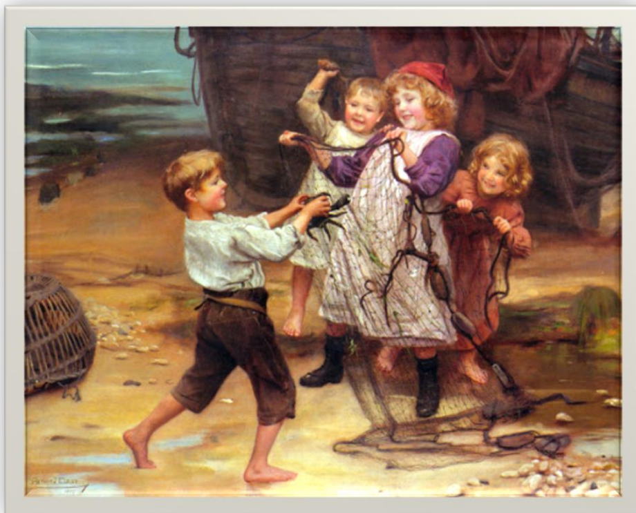
“Niños Jugando” de Arthur John Esley – Inglaterra - SXIX