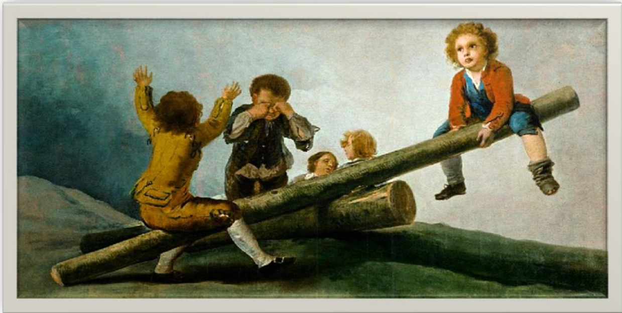
El balancín- Francisco de Goya - Francia - 1791

Observemos algunas imágenes de distintos artistas: