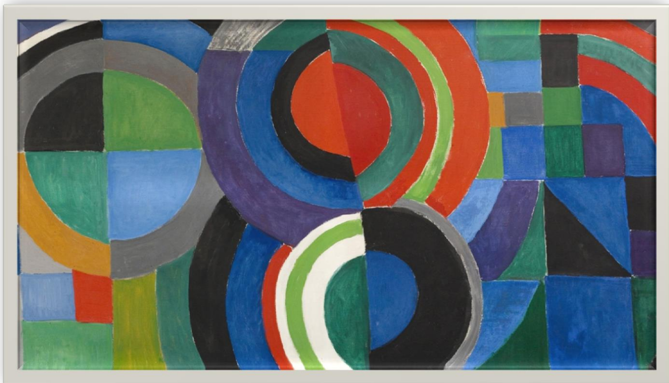
Ritmo color (1964)