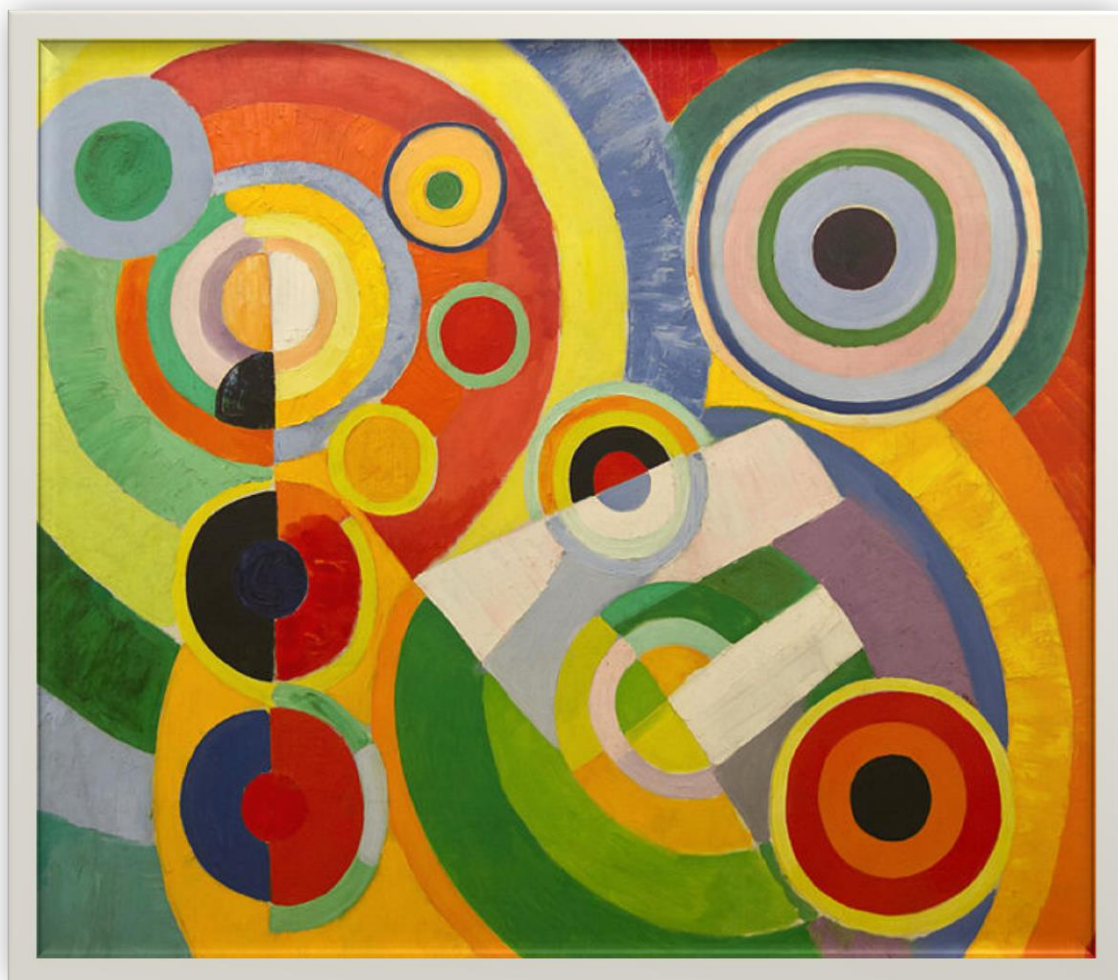
Rhythm, joie de vivre (1930)