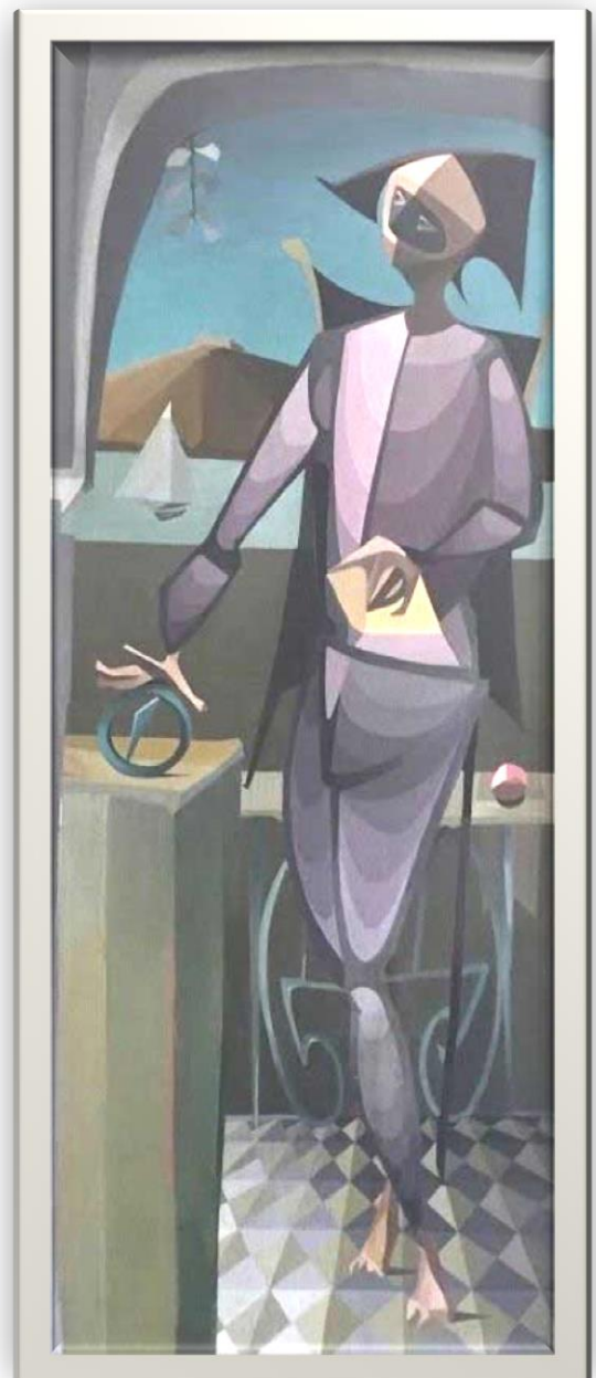
Nacimiento de Torroella de Montgrí de Juan Batlle Planas