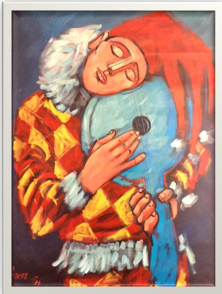
Arlequín durmiendo de Alvaro Valcarcel Strong